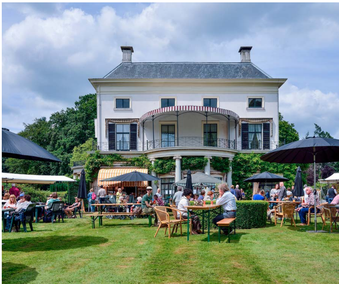
Buitenplaats Vollenhove met gardenfair, De Bilt

Een landschapsbiografie is op zichzelf beleidsneutraal omdat het een resultaat is van inventariserend onderzoek. De landschapsbiografie levert een karakterisering van de ruimte: Het integrale verhaal van het verleden. 'Wat heb ik' wordt hierin beschreven. 'Hoe ga ik ermee om' is ter beantwoording door het gebied. De landschapsbiografie is de basis voor het bepalen van de kernkwaliteiten van het gebied en de keuzes die gemaakt worden voor ontwikkeling van de ruimte, te behouden waarden, gewenst gebruik, etc.