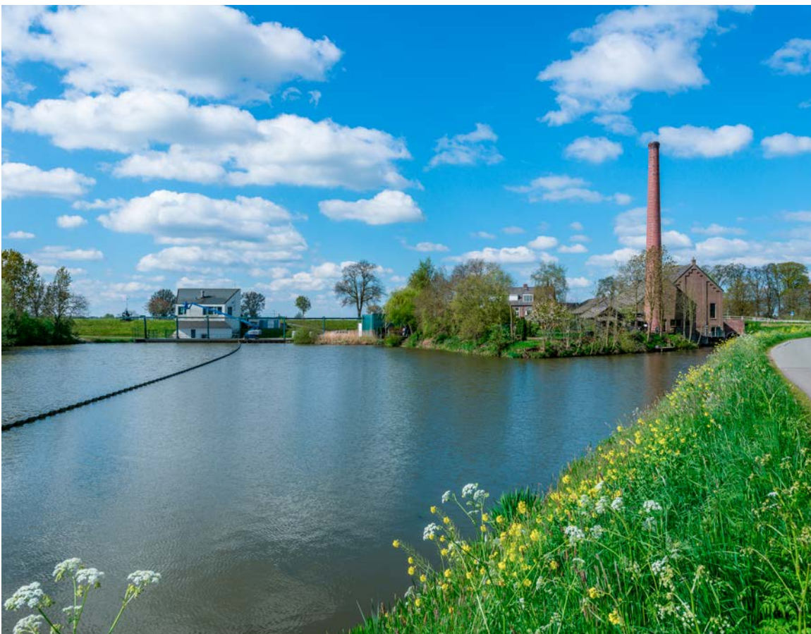
Gemaal de Tuut, Appeltern

Als resultaat van onderzoek is een landschapsbiografie op zichzelf beleidsneutraal. Uiteraard kunnen uitkomsten door het maken van keuzes worden vertaald in visies en beleid. Wat waarderen wij en wat is de moeite waard om te bewaren? Kunnen kernkwaliteiten benoemd worden? Hoe gaan we hiermee om in beheer en ontwikkelingen?