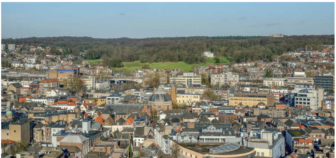
Uitzicht vanaf de Eusebius kerk, Arnhem

Door langdurige en intensieve menselijke invloed zijn de Nederlandse landschappen niet puur natuurlijk meer. Het zijn uitgesproken cultuurlandschappen geworden, in hoge mate mensenwerk. Sporen en structuren van verschillende ouderdom zijn erin herkenbaar. Die verbinden heden en verleden, ook in de beleving van bewoners. Landschappen zijn zowel het product van historische ontwikkelingen als het podium waarop de toekomst vorm krijgt. Want landschappen zullen blijven veranderen.