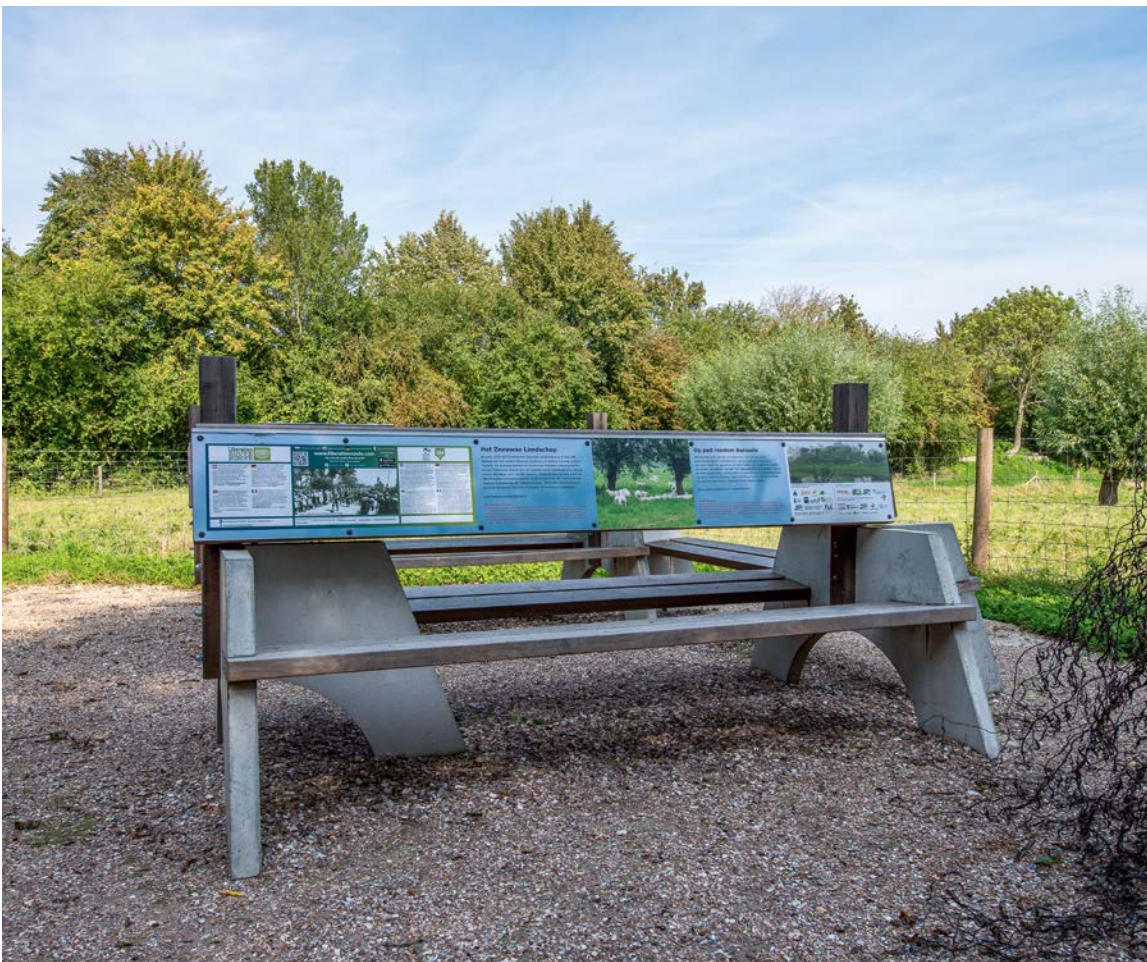
Bank met informatie over middeleeuws kasteelterrein Berg van Troje en streekgeschiedenis w.o. WOII, Borssele

Een goede landschapsbiografie begint met een duidelijke omschrijving van de opdracht. Deze bevat allereerst basisgegevens, zoals de opdrachtgever, de achtergrond van de vraag (bijvoorbeeld onderzoek ter voorbereiding op een erfgoednota of omgevingsvisie) relevante documenten, de keuze voor integraal of thematisch, de toegankelijkheid van gebied en gebouwen, de betrokken partijen en een globaal beeld van hun opvattingen en kennis van het landschap, de fasering van het onderzoek